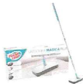
Vassoura Magica Plus Flash Limp