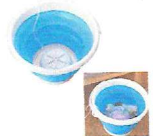
Kit Balde Retrátil 3 L + Mini Máquina de Lavar Portátil UE