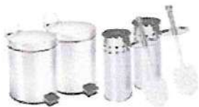
Kit 2 Lixeiras aço inox de 5 Litros e 2 escovas sanitárias...